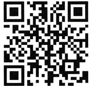
新規登録 QR コード

ログイン後、登録したお写真が画面右上に表示されます。クリックするとデジタル会員証が開きます。編集もそこから可能となります。